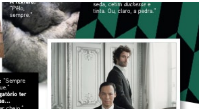
A textura: "Pêlo, seda, cetim duchesse e tinta. Ou, claro, a pedra."

A regra na decoração: "Sempre luz indirecta."