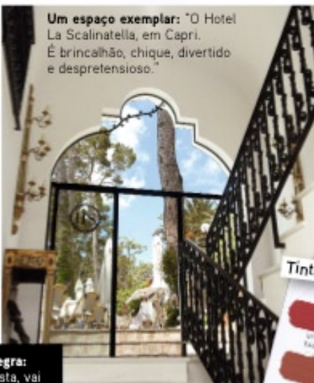
Um espaço exemplar: "O Hotel La Scalinatella, em Capri. É brincalhão, chique, divertido e desprezioso."

Uma regra: "Se gosta, vai funcionar." As moradas: "Para além da minha loja, o site que amo, 1stDibs.com"