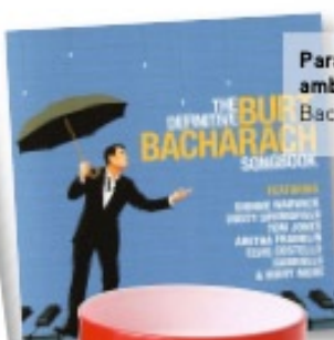
Para finalizar um ambiente: "Música de Burt Bacharach e Gainsbourg."

Começou como oleiro e apresentou o programa de televisão Top Design . Hoje, para além de projectos de decoração, desenvolve uma completa linha de produtos para casa que o torna numa referência mundial do design .