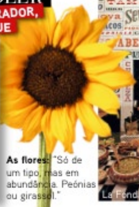
As flores: "Só de um tipo, mas em abundância. Peónias ou girassol."