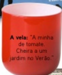
A vela: "A minha de tomate. Cheira a um jardim no Verão."

A peça obrigatória: "Um candeeiro fantástico. Nunca são demais."