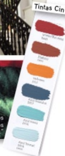
As cores: "Castanhos terra e azuis, usados em conjunto."