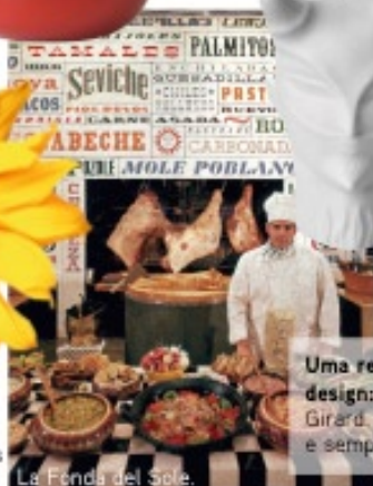
Uma referência no design: "Alexander Girard. Chique, criativo e sempre alegre."