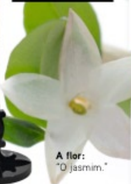
A flor: "O jasmim."

A vela: "Sempre Dyptique." É obrigatório ter em casa... "Um bar cheio." Para comprar arte: "A Galerie Kugel, no Quai d'Orsay, em Paris."