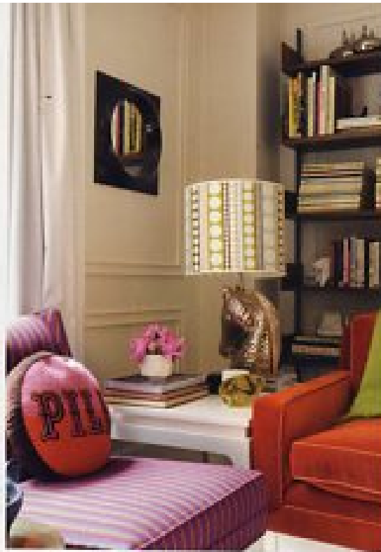
Foto's: Jonathan Adler met zijn partner Simon Doonan en hun hotel Liberman.