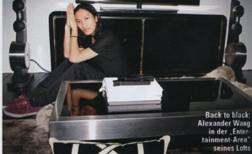
Back to black: Alexander Wang in der „Entertainment-Area“ seines Lofts