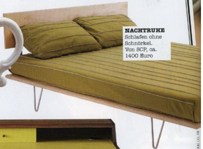
NACHTRUHE Schlafen ohne Schnörkel. Von SCP, ca. 1400 Euro