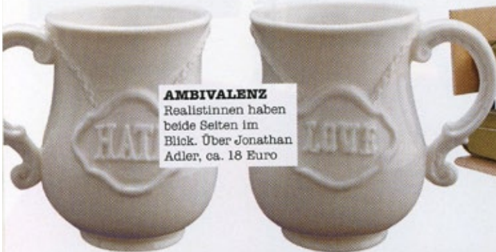
AMBIVALENZ Realistinnen haben beide Seiten im Blick. Über Jonathan Adler, ca. 18 Euro