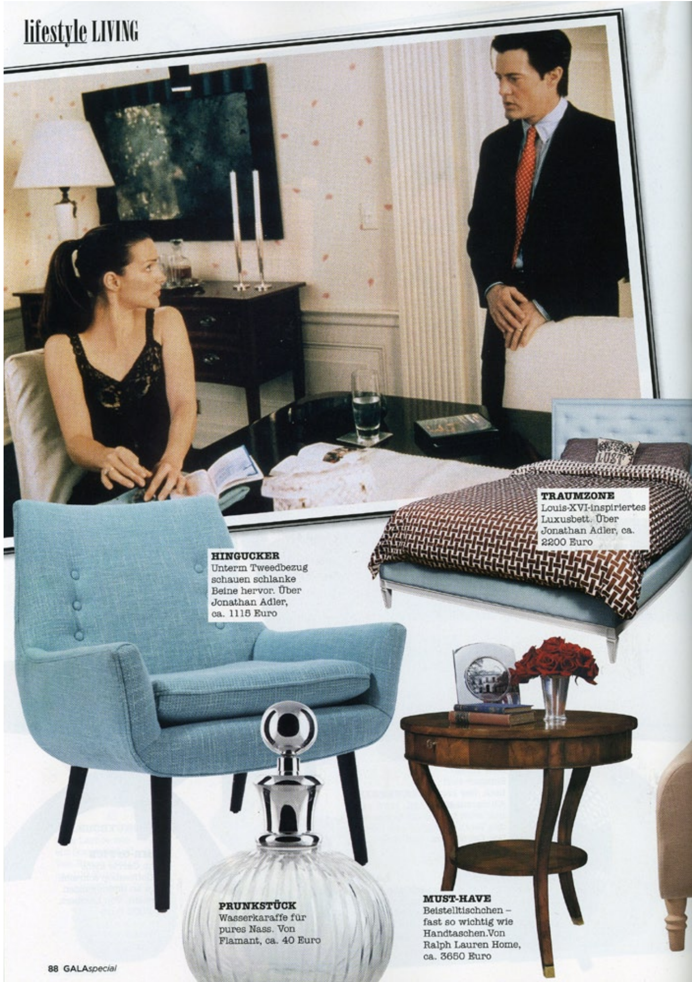
HINGUCKER Unterm Tweedbezug schauen schlanke Beine hervor. Über Jonathan Adler, ca. 1115 Euro