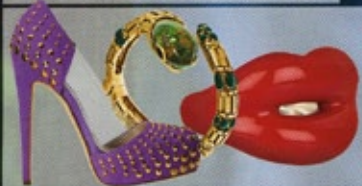
Sarah Jessica Parker