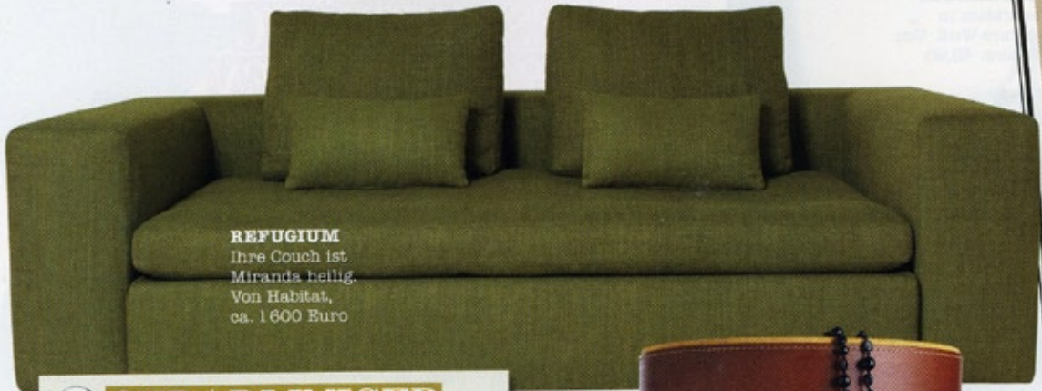
REFUGIUM Ihre Couch ist Miranda heilig. Von Habitat, ca. 1600 Euro