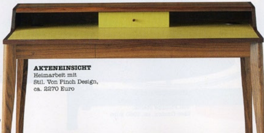
AKTENEINSICHT Heimarbeit mit Stil. Von Pinch Design, ca. 2270 Euro