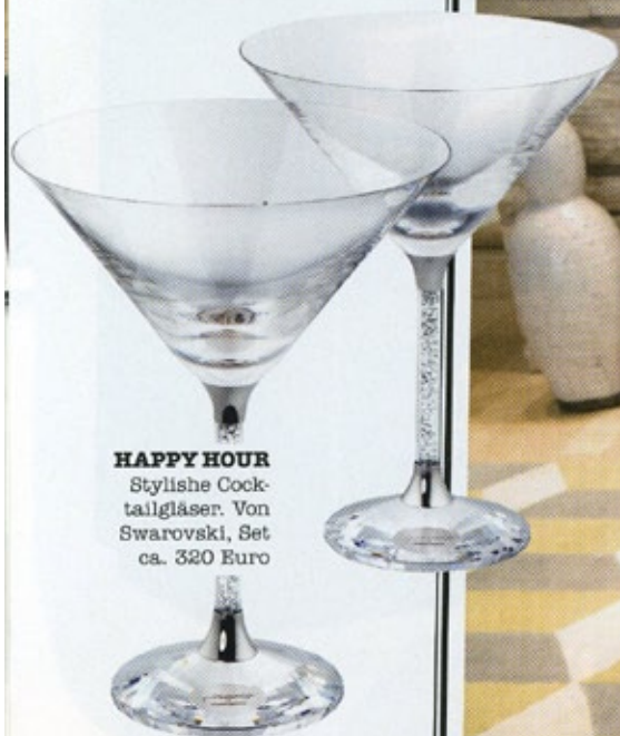
HAPPY HOUR Stylische Cock- tailgläser. Von Swarovski, Set ca. 320 Euro

Man könnte sich auch, &h, im Gefecht daran abstützen... Von Kare, ca. 700 Euro